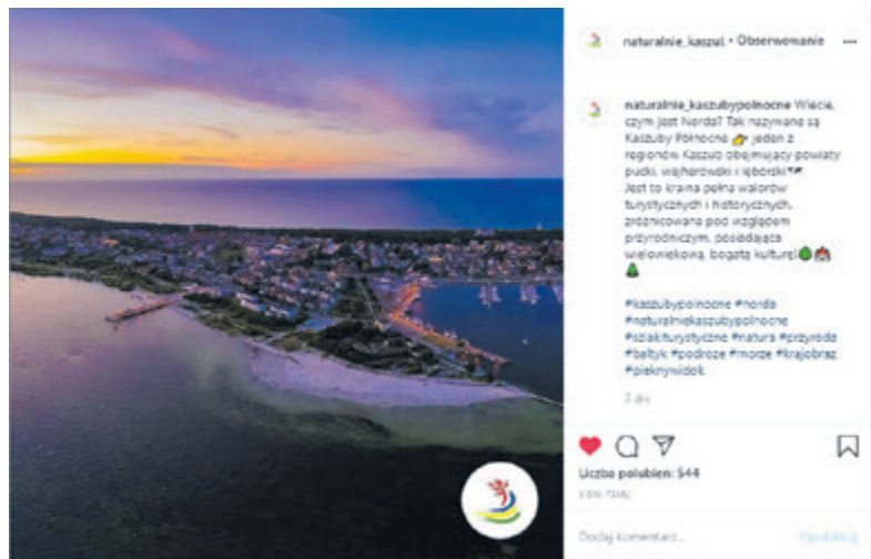
Cykl „Odkryj Nordę” o magicznych miejscach na kanale „Naturalnie, Kaszuby Północne”

Z początkiem roku uruchomiliśmy dwa kanały na Facebooku i na Instagramie. Pierwszy dotyczy kultury rybackiej i morskiej Kaszub Północnych (rybołówstwo, wędkarstwo, żeglowność) i nosi tytuł: „Zacumuj na Kaszubach Północnych”. Drugi opiera się o ekoturystykę, turystykę przyrodniczą i nazwaliśmy go „Naturalnie, Kaszuby Północne”.