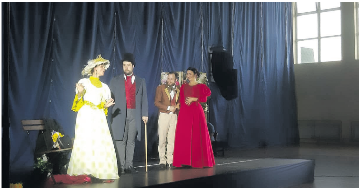
Adaptacja twórczości Aleksandra Fredry w wykonaniu Teatru Nobilis

W dniach 10–23 sierpnia przy Urzędzie Miejskim w Jastarni odbywały się „Wakacje z historią”, obejmujące imitację obozu wojskowego, przejażdżki zabytkowymi pojazdami wojskowymi, ekspozycję umundurowania, broni i kuchni polowej. Wyjątkowa gratka dla miłośników militariów.