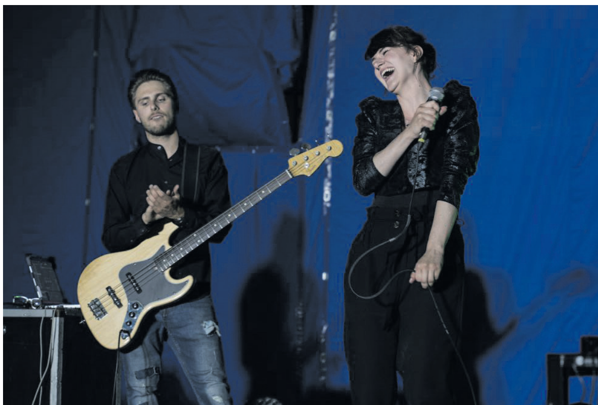
Festiwal „A MORZE DŻEZ” z zespołem Leśne zwierzęta