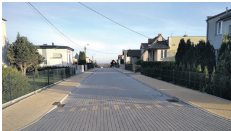
Osiedle tzw. działki w Sławoszynie

za niemal 2,0 mln zł będą wykonywane do lata 2021 r.