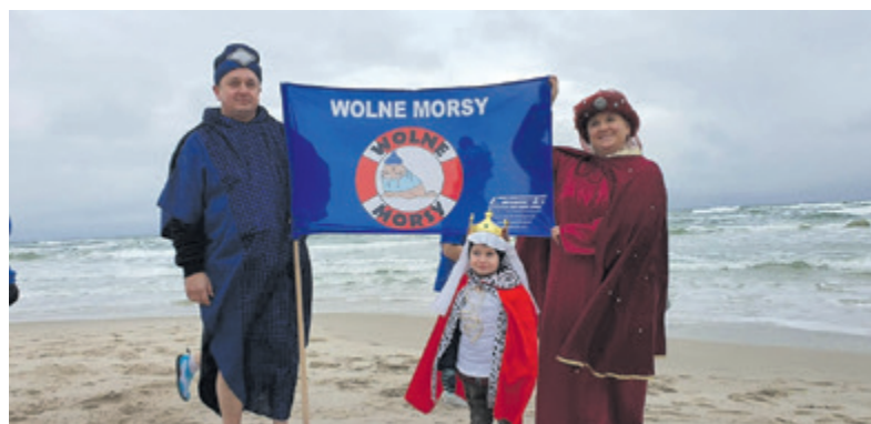
Podczas Święta Trzech Króli