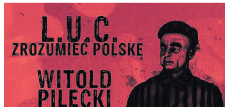
Widowisko muzyczno-historyczne dostępne na kanale YT moksir jastarnia