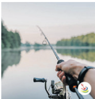
Cykl „Z wędką na Kaszuby” można śledzić na profilu „Zacumuj na Kaszubach Północnych”

1. Odkryj Nordę – cykl przedstawiający niezwykle i magiczne miejsca Kaszub Północnych, szczególnie te mniej uczęszczane przez ludzi. W tej linii postów chcemy nawiązywać do przyrodniczych aspektów regionu. Przedstawimy Kaszuby Północne jako najbardziej zróżnicowany obszar pod względem geograficznym w Polsce Północnej i pokażemy jego naturalne bogactwo.