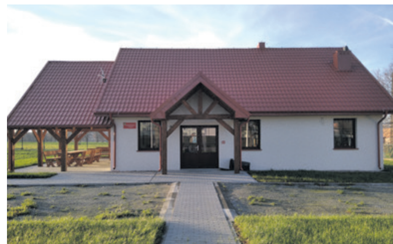
Świetlica w Kłaninie