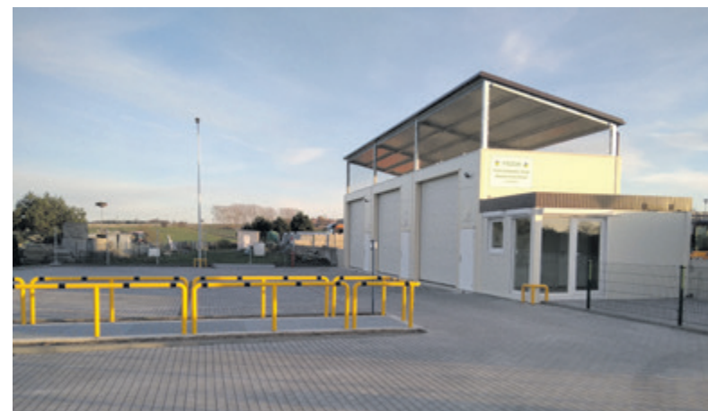
Nowy Punkt Selektywnej Zbiorki Odpadów

Nowe odcinki chodników powstają także przy drogach gminnych w Białogórze (ul. Morska), w Prusowie (ul. Tartaczna), czy w Odargowie (ul. Kartoszyńska). Polepszyliśmy stan ul. Łąkowej w Brzynie oraz dojazd do Dąbrowy. W trakcie budowy nawierzchni jest ul. Nowa w Minkowicach. Na te zadania wydatkujemy łącznie około 400 tys. zł