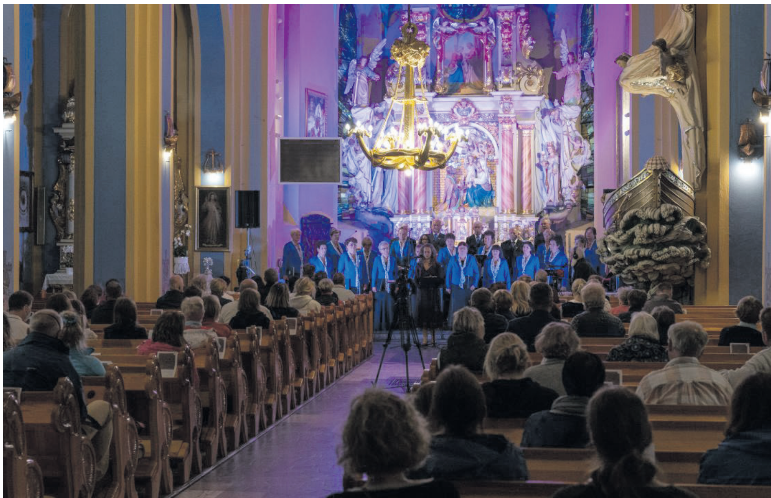
Koncert dialogowy na chór, organy i saksofon w jastarnickim kościele

Mocnym akcentem kończącym nieco krótszy niż zwykle kalendarz