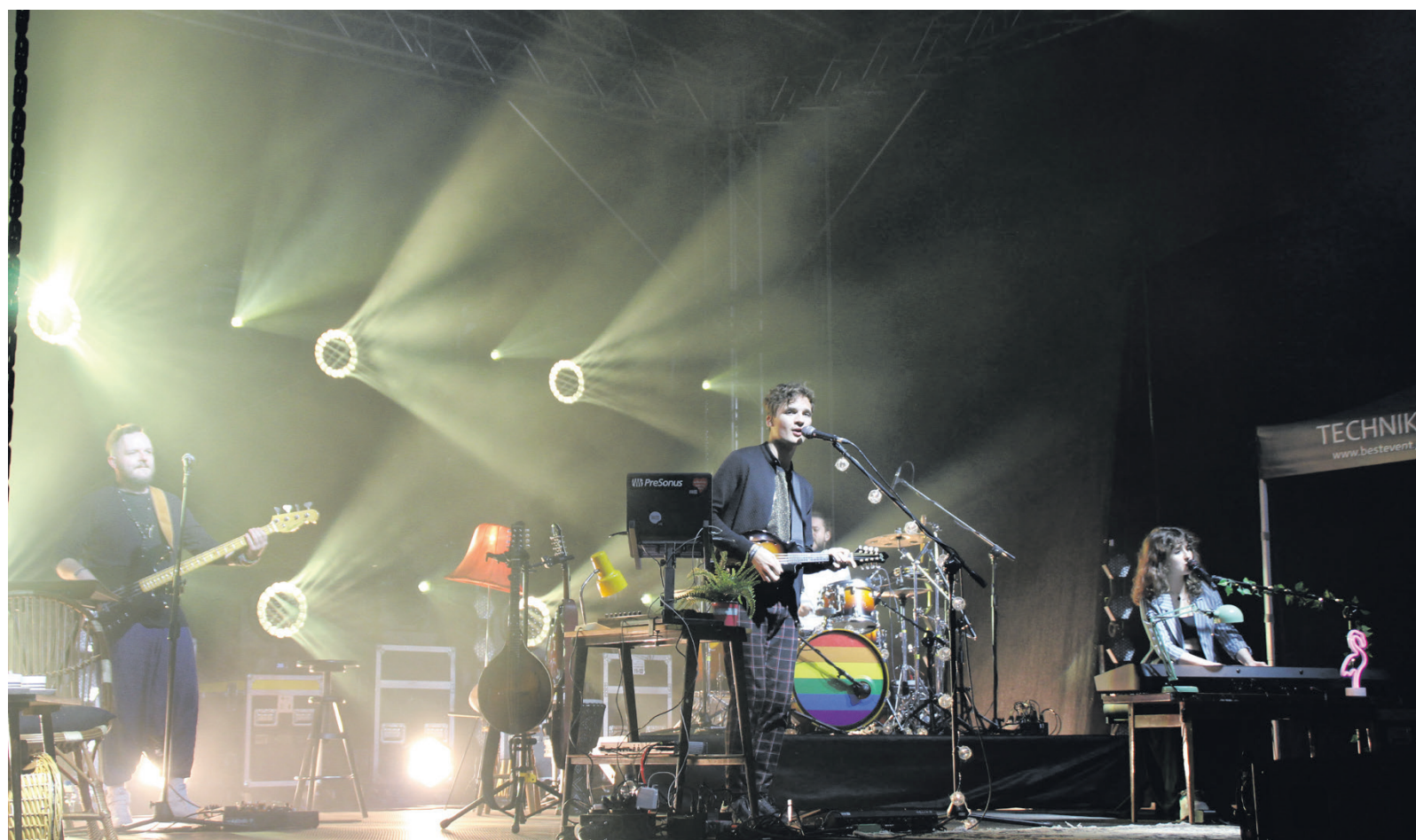
Kwiat Jabłoni podczas festiwalu Salty Sounds

Spowodowane to było oczywiście wprowadzeniem obostrzeń, służących zwalczaniu pandemii SARS-CoV-2.