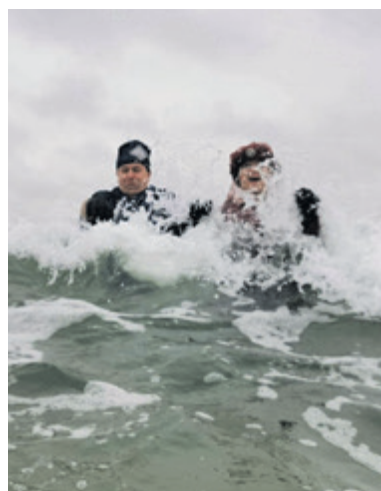
W przebraniu zażywają kąpeli zimowych