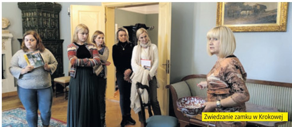
Zwiedzanie zamku w Krokowej