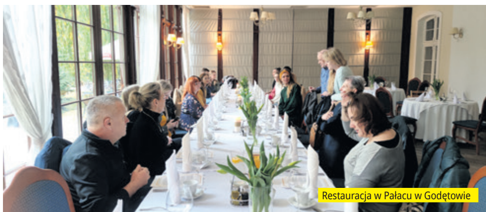
Restauracja w Pałacu w Godętowie