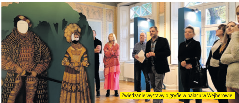
Zwiedzanie wystawy o gryfie w pałacu w Wejherowie