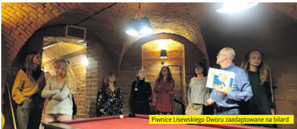
Piwnice Lisewskiego Dworu zaadaptowane na bilard