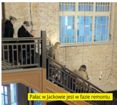
Pałac w Jackowie jest w fazie remontu