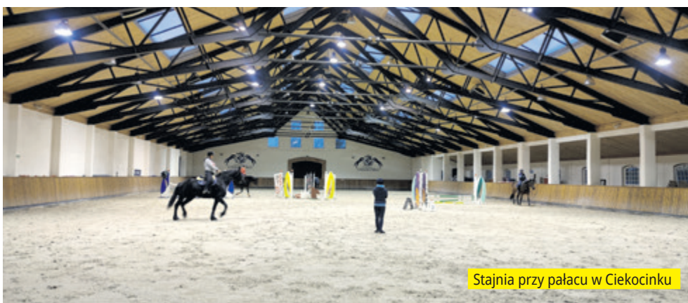
Stajnia przy pałacu w Ciekocinku