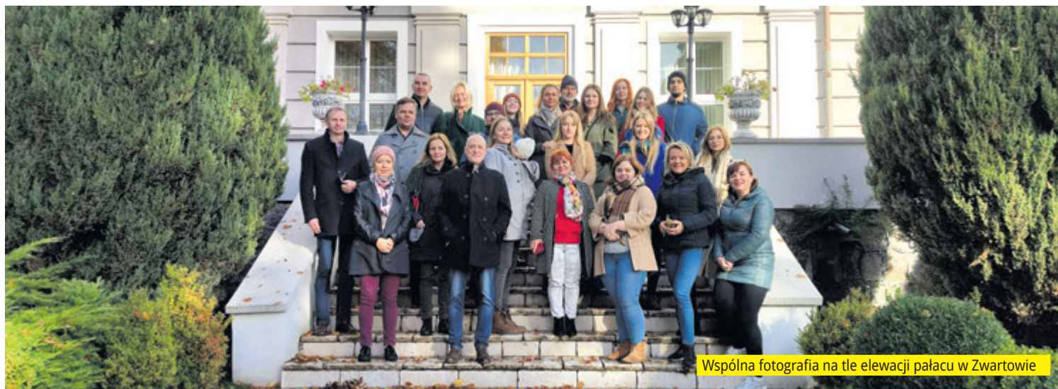
Wspólna fotografia na tle elewacji pałacu w Zwartowie