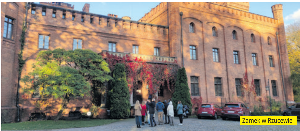
Zamek w Rzućwie