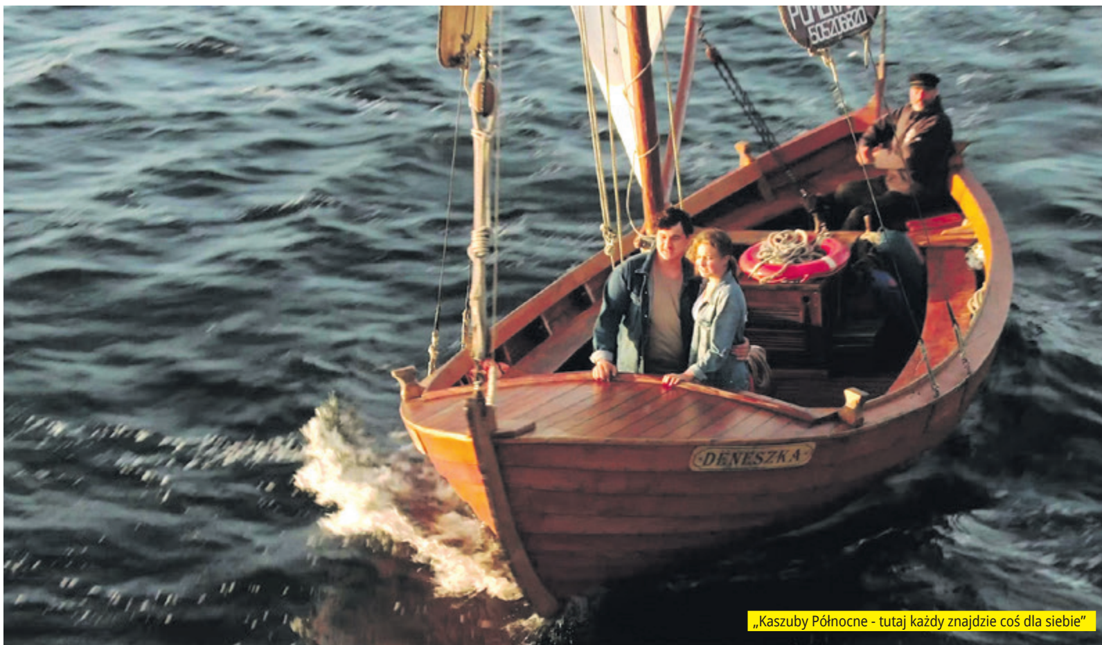
„Kaszuby Północne – tutaj każdy znajdzie coś dla siebie”

W reportażu pokonkursowym czytamy: „Bardzo ciekawe filmy przyszły z najdalszych zakątków świata: z Afryki, Australii, Japonii, Rosji. O najwyższe nagrody walczyły także